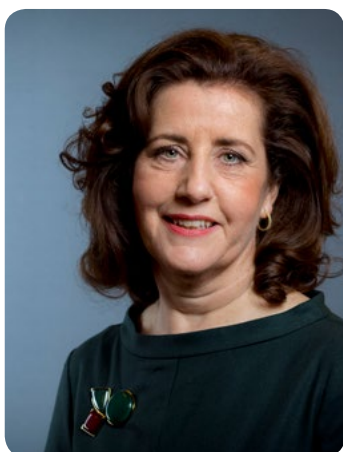
Ingrid van Engelshoven - Minister van Onderwijs, Cultuur en Wetenschap